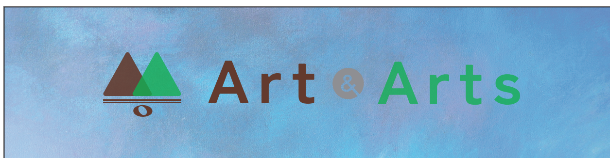
視認性の低い背景での使用